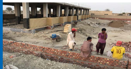
دیوار محوطه و تیغه چینی نما ۲۱ مرداد ۹۶

مراحل اجرای مدرسه دخترانه بعد از وقفه کوتاهی دوباره سرعت گرفته است. زمان زیادی تا به واقعیت رسیدن آرزوی دختران صدیق زهی نمانده است.